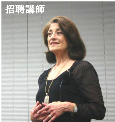
カルメン・ボスティック・サンクレア女史 ニューコードNLP共同創始者

グリンダー博士と従来のNLPをさらに進化させたニューコードNLPを共同開発している。政治学の博士号、MBA、司法博士号を有しており、米国内で中規模企業のCEO（最高経営責任者）を歴任。レーガン政権下では政府内米国内中小企業育成顧問を、ブッシュ政権下では国内企業育成のための好条件環境の準備政策に関してカリフォルニア代表顧問を務めるなど華々しい経歴を持っている。グリンダー博士のワークショップや講演などに影のように付き添い、受講生の自発性と気づきを引き出すエレガントなワークやプレゼンテーションには定評がある。